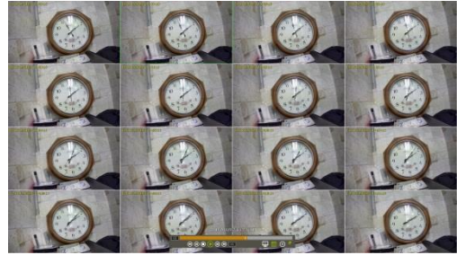
[다중시간 검색 화면]